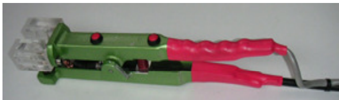
Pince mobile à ressort pour des réparations sans démontage.

Ref: 67220-pince Eyelets Tarif: 1250.00 €