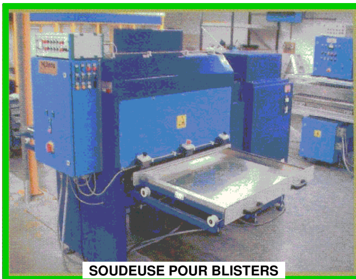
SOUDEUSE POUR BLISTERS